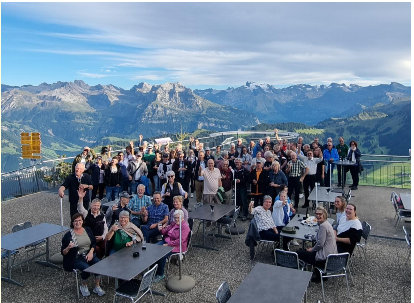
Rund 100 Mitarbeiterinnen und Mitarbeiter beim Sommerfest auf dem Stanserhorn.

Das Protokoll der Generalversammlung ist auf der Webseite www.stanserhorn.ch einsehbar.